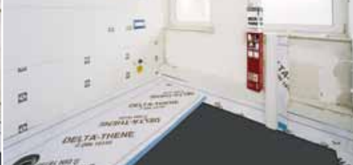
Гидроизоляция пола во влажных помещениях.