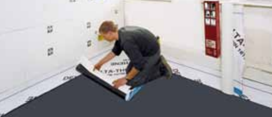
Быстрая укладка без наплавления.