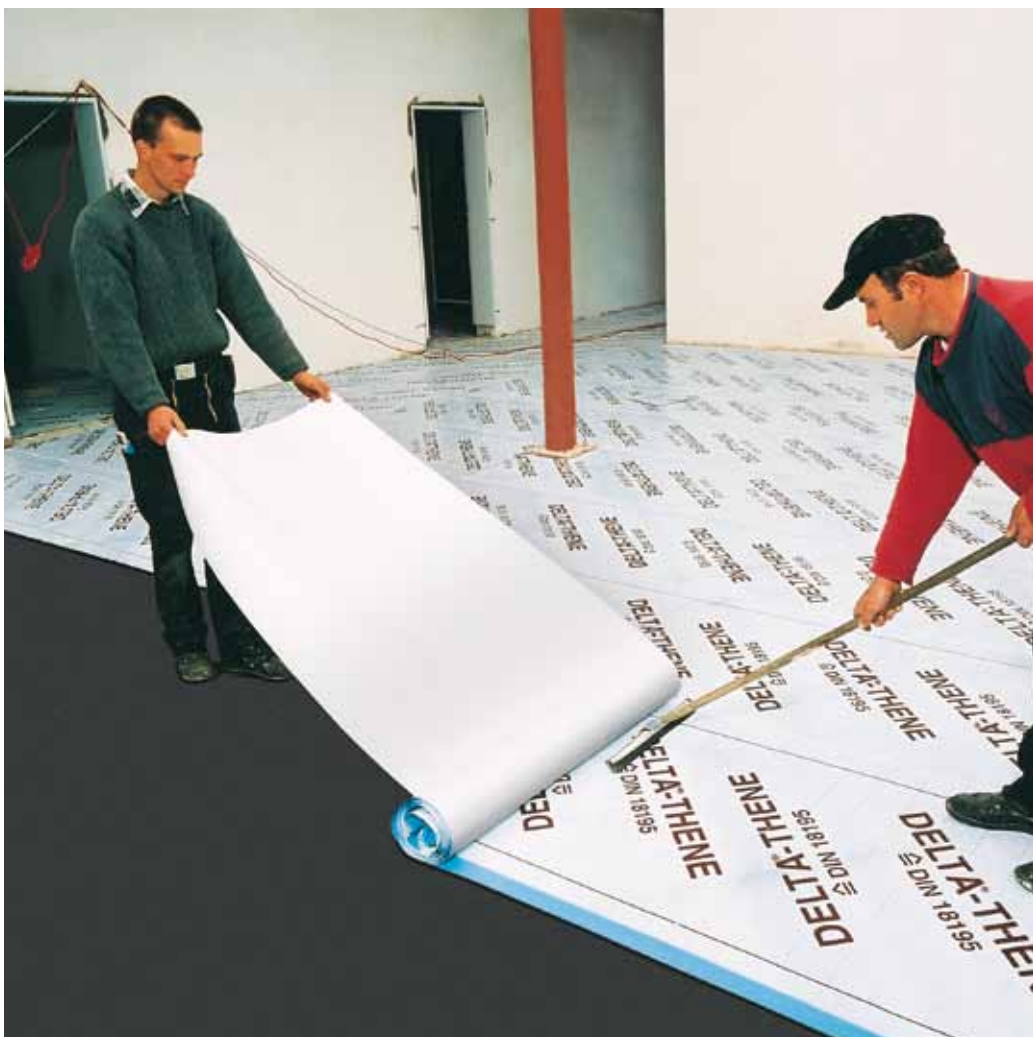
С помощью DELTA®-THENE очень просто обеспечить гидроизоляцию больших площадей.