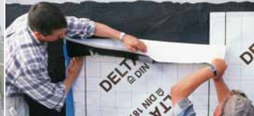
Гидроизоляция стен подвалов.